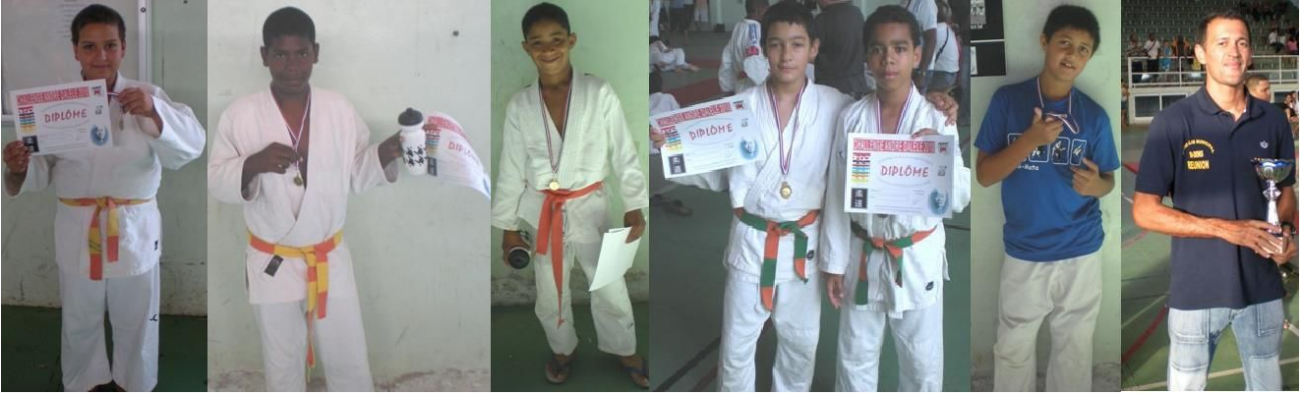
Christol 1 er