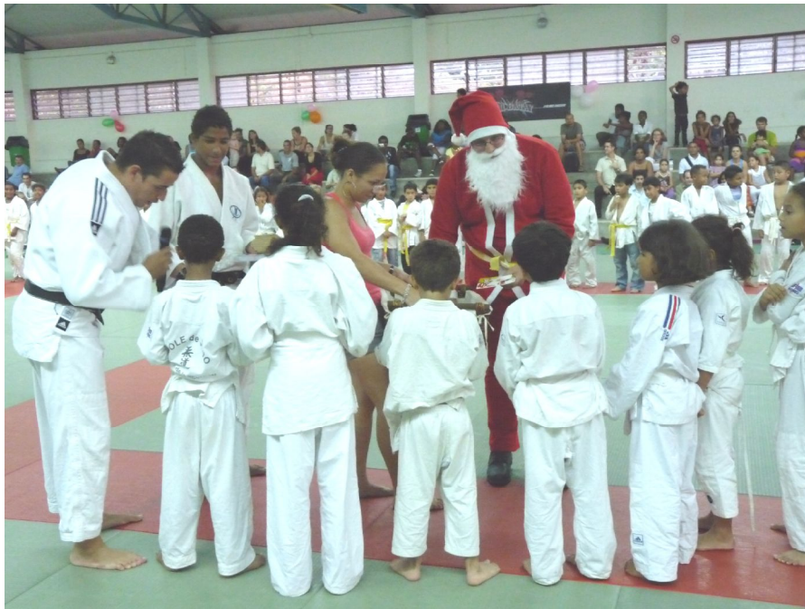
A la fin de l'entraînement commun, le Père Noël est arrivé pour la traditionnelle distribution de cadeaux.