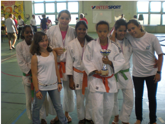
Equipe Championne des Minimes Filles.