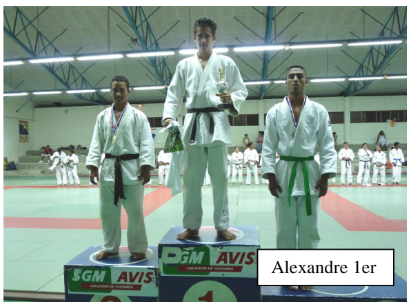
Alexandre 1 er