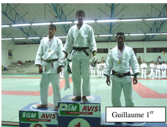
Guillaume 1 er