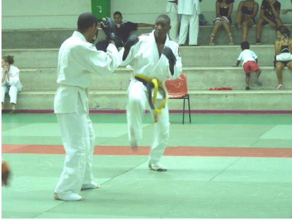
Démonstration de JuJitsu