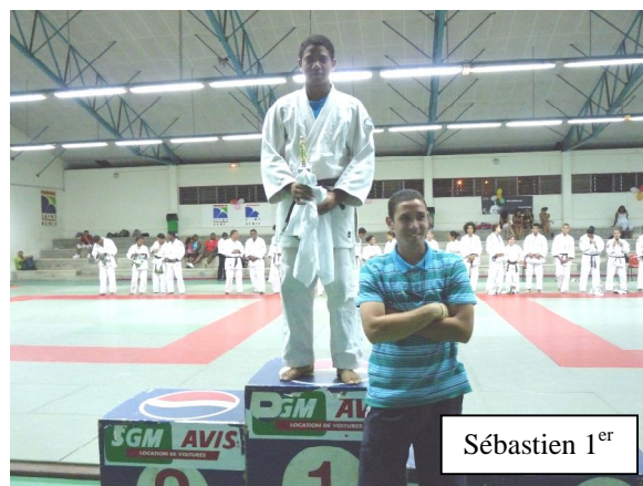
Sébastien 1 er