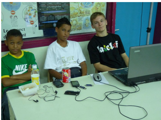
Les DJs de la manifestation