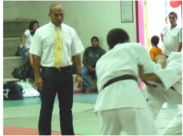
Un Arbitre très attentif !