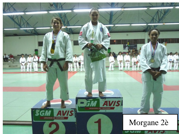
Morgane 2 è