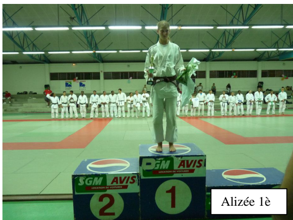
Alizée 1 è