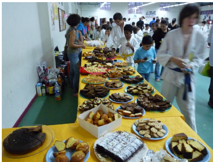
Pour terminer, distribution de pâtisseries et de boissons. Merci aux parents pour leur aimable contribution.

Pour plus d'infos et de photos, voir le site internet du club = http://www.jcm974stdenis.org/