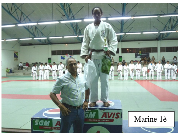
Marine 1 è