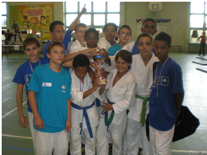
Equipe Championne des Minimes Garçons.

Pour plus d'infos et de photos, voir le site internet du club = http://www.jcm974stdenis.org/