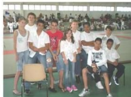
Arbitres et Commissaires Sportifs

Ce Dimanche 7 Novembre était le jour de la première compétition de l'année pour nos benjamins qui se sont bien comportés avec 7 médailles d'or remportées.