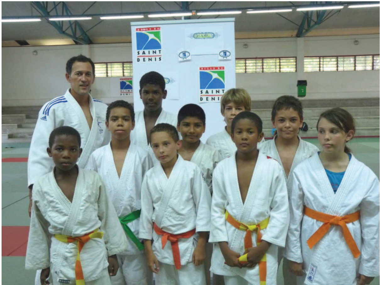
Nos vainqueurs du Challenge Benjamins

Pour plus d'infos et de photos, voir le site internet du club = http://www.jcm974stdenis.org/