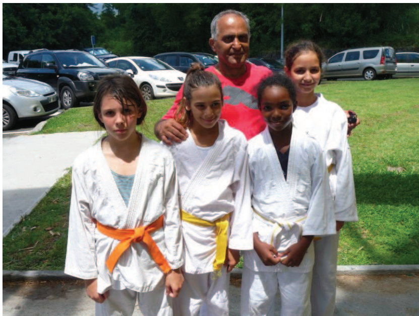
Le Président et l'équipe des Benjamins

Avec 10 victoires, notre club remporte le Challenge.