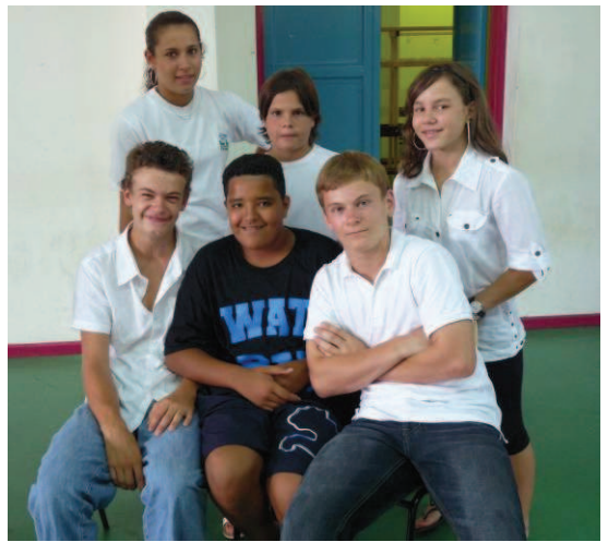
Les jeunes arbitres du club.